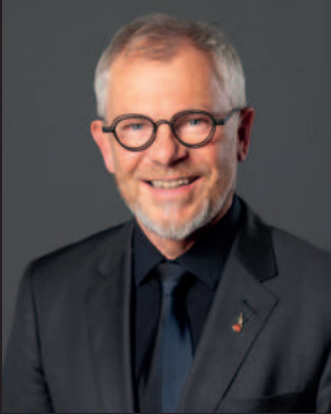
Peter F. Pfister Weltpräsident der Intercoiffure Mondial

Herzlich willkommen beim Intercoiffure World Congress 2025 in Hamburg, Germany.