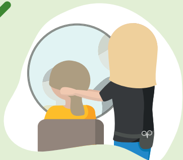
Beratung über den Spiegel