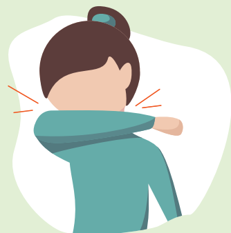
Hust- und Niesetikette beachten